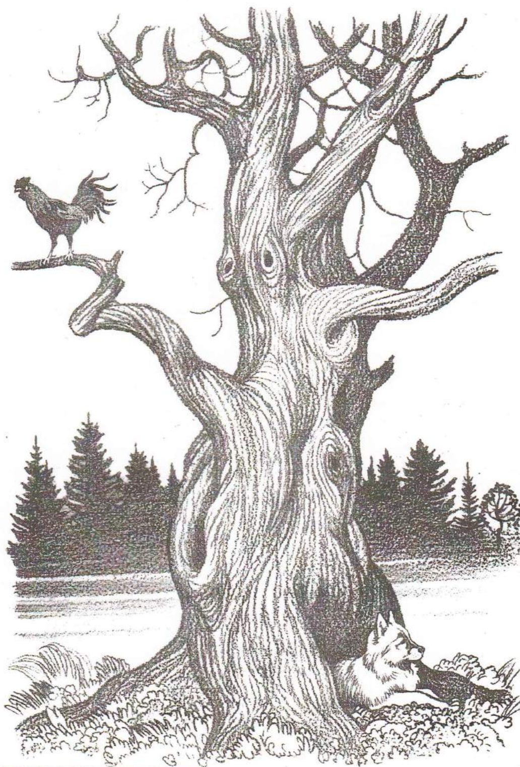
Рис.2 Выбор сюжета ( иллюстрация из детской книги)