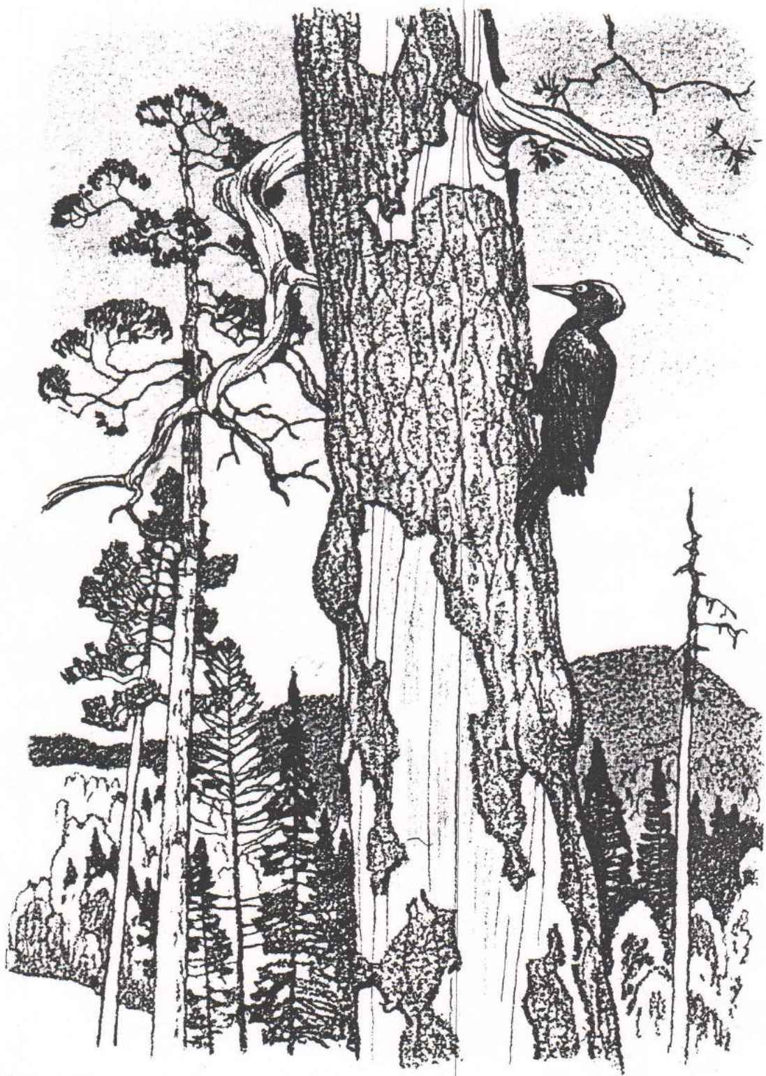
Рис.1 Выбор сюжета (иллюстрация из книги)