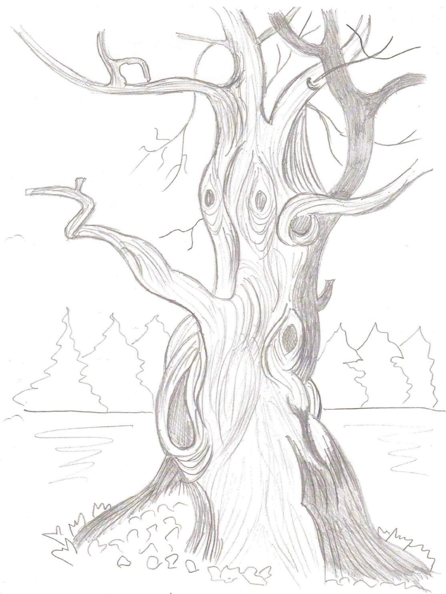
Рис.3 Эскиз выбранного сюжета