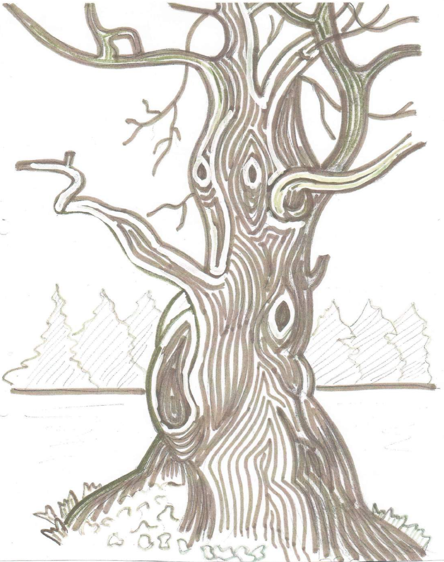
Рис. 5 Заключительный этап: последовательное наклеивание нитей разного цвета ( светлого, темного)